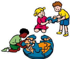
We dragen allemaal een steentje bij

De mediatorentoetsing voor een groep kinderen uit groep 7-8 is afgerond. De leerlingen konden kiezen of zij deze wilden ontvangen. De leerlingen die hebben meegedaan en de lessen hebben afgerond, lopen nu in de pauzes rond om te mediëren bij conflicten, als dat nodig is. Dit zijn situaties, waarbij een meningsverschil optreedt tussen leerlingen. In de training hebben ze o.a. geleerd dat ze bij ruzies geen mediërende rol hebben, maar dat ze dan de leerkrachten of overblijfsmoeders inschakelen.